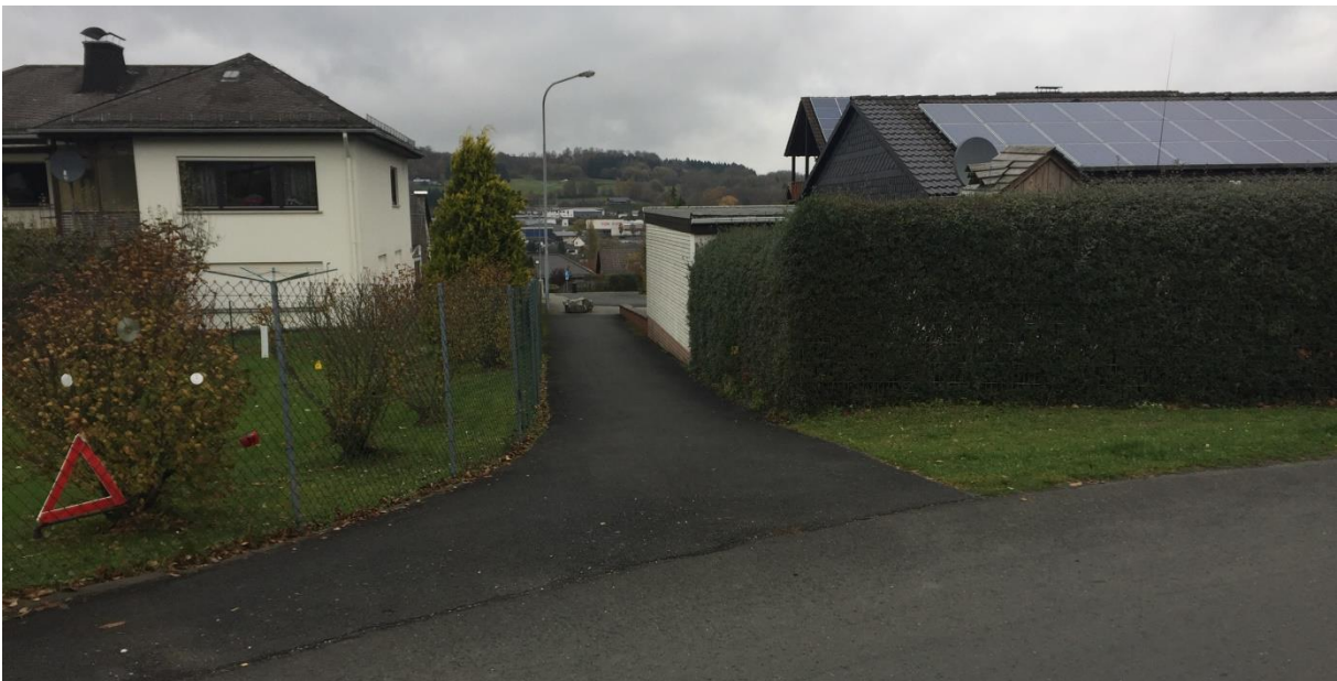
Abb. 2: Vorhandener Fußweg in das nördlich angrenzende Wohngebiet (Aufnahme Büro Zillinger in, November 2017)

Um die fußläufige Verbindung bzw. Durchgängigkeit in das nördlich gelegene Wohngebiet zu ermöglichen, wurde am westlichen Rand des Geltungsbereiches ein Fußweg festgesetzt, der an den bereits vorhandenen Fußweg anschließt, s Abb. 2.