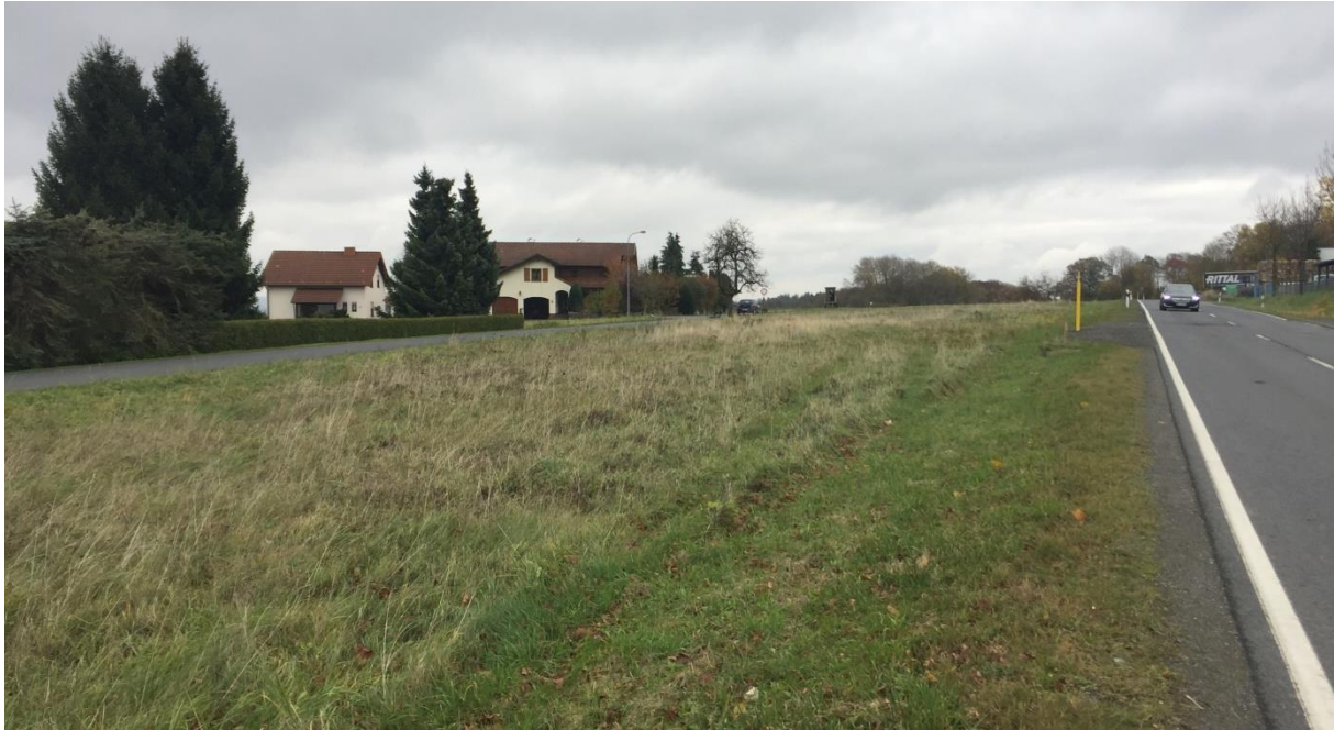
Abb. 4: Blick über den Geltungsbereich in Richtung Osten (Aufnahme Büro Zillinger, November 2017)

Im Gebiet bestehen keine besonderen klimatischen Verhältnisse. Besondere klimatische Funktionsräume, wie zum Beispiel ein Gewässer, ein Feuchtbiotop oder besondere Wiesen und Waldflächen, sind nicht vorhanden.