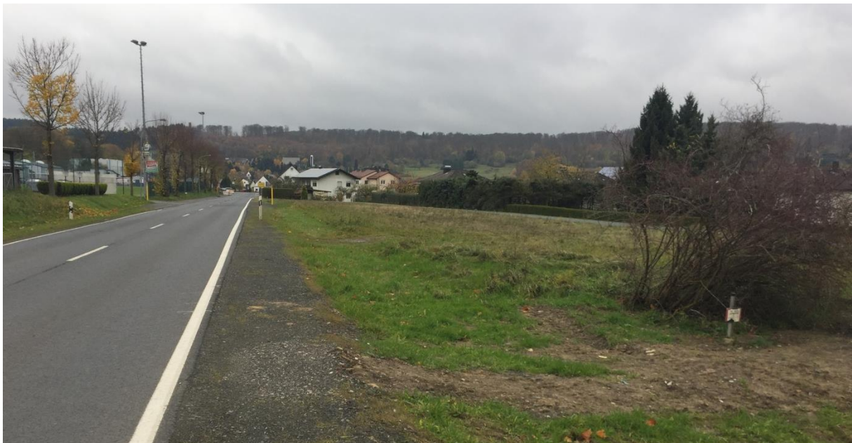
Abb. 3: Blick über den Geltungsbereich in Richtung Westen (Aufnahme Büro Zillinger, November 2017)

Vorsorglich und um einen Umweltschaden zu vermeiden, wurde eine Bestandsaufnahme durchgeführt, die auch fotografisch festgehalten wurde.